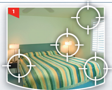
Fugen, Hohlräume und Ritzen