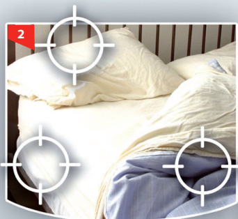
Matratze, Bettrahmen, Kopfbrett, Bettpfosten