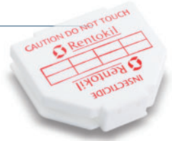
Spritzwasserdichte Fallen: Stopp für Schabe & Co.

dem Einsatz von Fraßködergelern bietet Rentokil seinen Kunden zudem innovative Sonderbehandlungen wie die Wärmeentwesung, bei der giftfrei und mittels gezielter Temperaturerhöhung Hygieneschädlinge abgetötet werden. Auch bei der immer häufiger vorkommenden, hoch infektiösen Pharaoameise halten wir hervorragend bewährte Köderverfahren bereit, um die bernsteingelben Eiweißfresser professionell zu beseitigen.