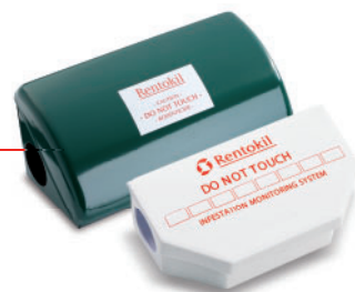
Köderboxen: Abwehr von Schadnagern

Bauliche Schwachstellen wie Fugen, Risse oder Löcher in Mauerwerk, Decken und Türen bieten Schadnagern ideale Einwanderungsmöglichkeiten, die sich durch geeignete Maßnahmen wie z. B. die Anbringung von Türbürsten verhindern lassen.