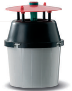
Pheromonfallen: Sexuallockstoff gegen Motten

In schwierigen Fällen bieten wir Ihnen professionelle Sonderlösungen wie das Wärme- oder Kombiverfahren.