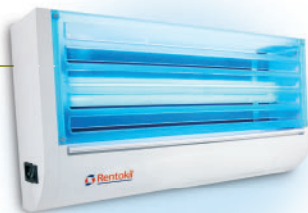
Luminos Economy: Effizienz und Wirtschaftlichkeit

Zur Absicherung von Fenstern z. B. in Wurstküche sowie Zerlege- und Maschinenraum empfiehlt Rentokil den Einsatz geeigneter Fliegengitter.