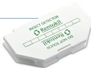
Klebfallen: Stopp für Schabe & Co.

Einsatz von Fraßködergelen bietet Rentokil seinen Kunden zudem innovative Sonderbehandlungen wie die Wärmeentwesung, bei der giftfrei und mittels gezielter Temperaturerhöhung Hygiene-schädlinge abgetötet werden. Auch bei der immer häufiger vorkommenden, hoch infektiösen Pharaoameise halten wir hervorragend bewährte Köderverfahren bereit, um die bernsteingelben Eiweißfresser professionell zu beseitigen.