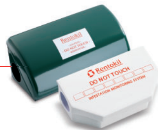
Köderboxen: Abwehr von Schadnagern

Bauliche Schwachstellen wie Fugen, Risse oder Löcher in Mauerwerk, Decken und Türen bieten Schadnagern ideale Einwanderungsmöglichkeiten, die sich durch geeignete Maßnahmen wie z. B. die Anbringung von Türbürsten verhindern lassen.