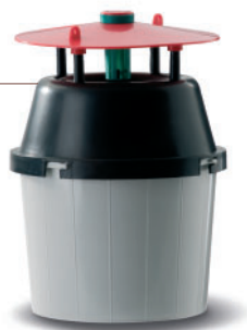
Pheromonfallen: Sexuallockstoff gegen Motten

wirkungsvoll durch optimale Systeme zur Überwachung und Bekämpfung: Klebfallen mit artspezifischen Pheromon-ködern sowie Pheromonfallen ermöglichen ein effizientes Monitoring im Sinne des HACCP, um Populationsentwicklungen zu kontrollieren und Bekämpfungsmaßnahmen rechtzeitig einzuleiten. In schwierigen Fällen bieten wir Ihnen professionelle Sonderlösungen wie das Wärme- oder Kombiverfahren.