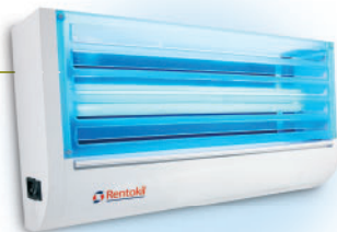
Luminos Economy: Effizienz und Wirtschaftlichkeit

Zur Absicherung von Fenstern z. B. in Backraum und Konditorei empfiehlt Rentokil den Einsatz geeigneter Fliegengitter.