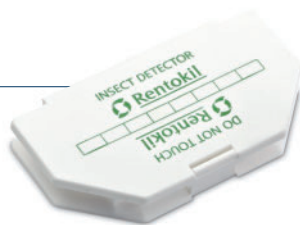
Klebefallen: Stopp für Schabe & Co.

Daneben ärgern Weg- oder Gartenameisen den Gastrono-