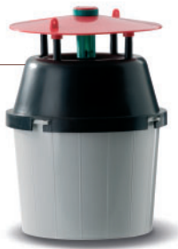
Pheromonfallen: Sexuallockstoff gegen Motten

Rentokil schützt Ihre Güter durch optimale Systeme zur Überwachung und Bekämpfung, wie z.B. durch Klebefallen mit artspezifischen Pheromonködern sowie