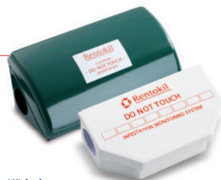
Köderboxen: Abwehr von Schadnagern

Bauliche Schwachstellen wie Fugen, Risse und Löcher in Mauerwerk, Decken und Türen bieten Schadnagern ideale Einschluflmöglichkeiten ins Gebäude-