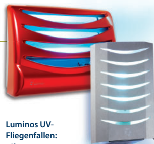
Luminos UV-Fliegenfallen: Effizienz & Design

Daneben schützt Rentokil Ihre Gäste durch Wespenfallen mit speziellen Lockstoffessenzen , beseitigt auf Wunsch Wespen-